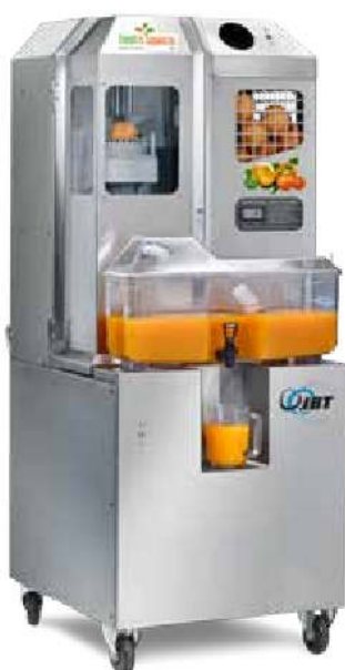
Versione carter in acciaio inox

Perciò, se avete scelto di offrire prodotti naturali e freschi, come succo di arancia o succo di limone, fate provare ai vostri clienti i succhi preparati con l'estrattore Fresh'n Squeeze Multi-Fruit Juicer.